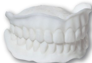
単色で造形された 試適用義歯

※『トライ・イン』インクは保険適用外の材料であるため、材料費としての算定は行えません。 算定対象となるのは、試適に該当する歯科医師の手技に対する点数（仮床試適料）です。